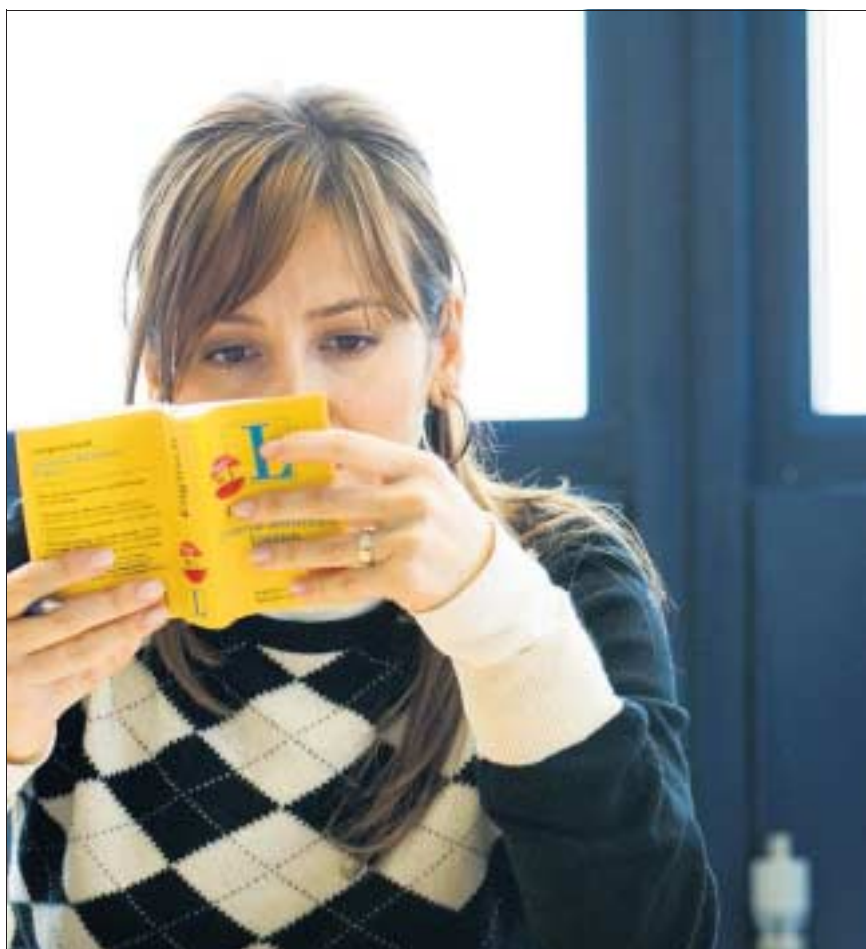
Englisch wird immer wichtiger und ebenso das anerkannte Diplom.

Die Websites und Kataloge der Anbieter werben mit ausführlichen Beschreibungen, Fotos und Videos von attraktiven Schulen, pulsierenden Städten und wunderbaren Landschaften. Erlebnisberichte von Sprachstudenten geben Einblick in das Leben auf dem Campus. Es ist nicht einfach, sich im Dschungel der Angebote zurechtzufinden. Schon der Besuch der Websites einiger weniger Agenturen mit Dutzenden von Links zu den Partner-